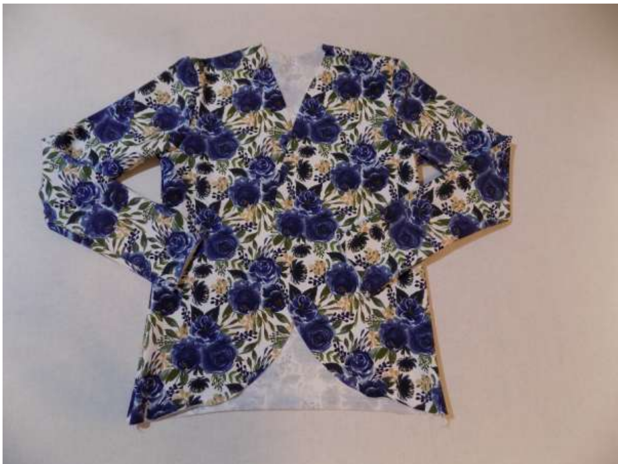
14. Pohled z lícu.