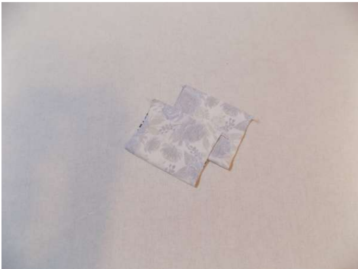
16. Pohled na sešité manžety v rubu.