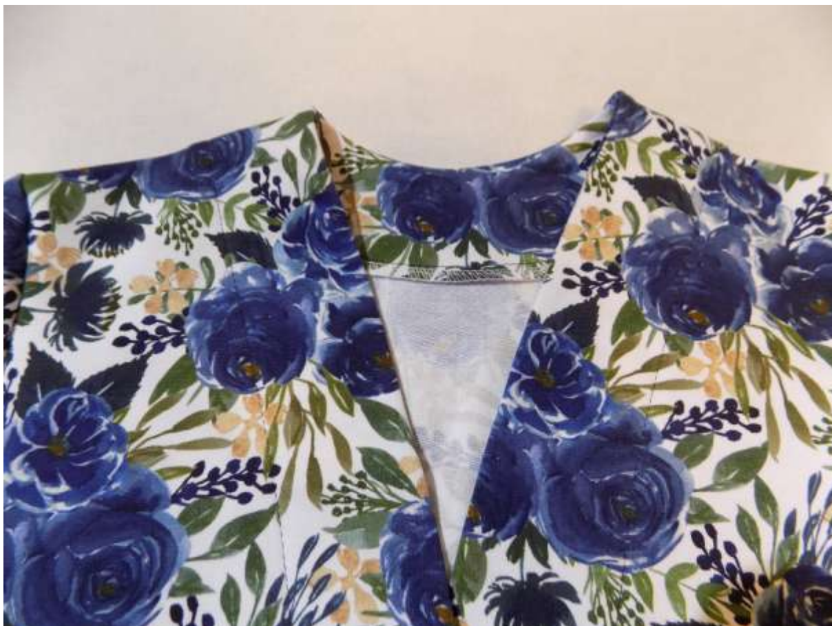
25. Detail průkrčníku.