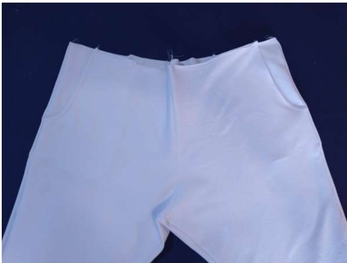
17. Pohled z lícu.