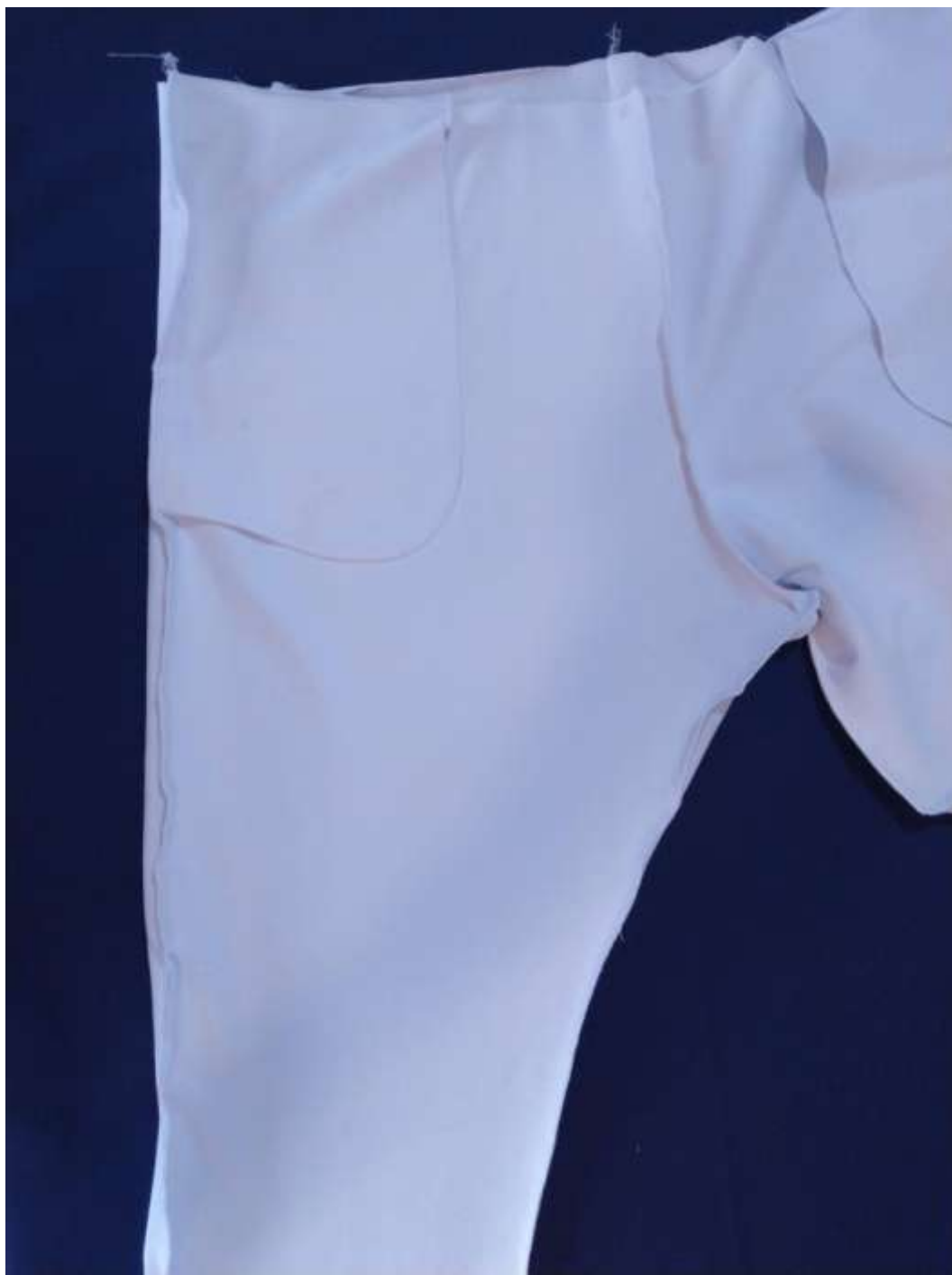
16. Pohled z rubu na sešité díly.