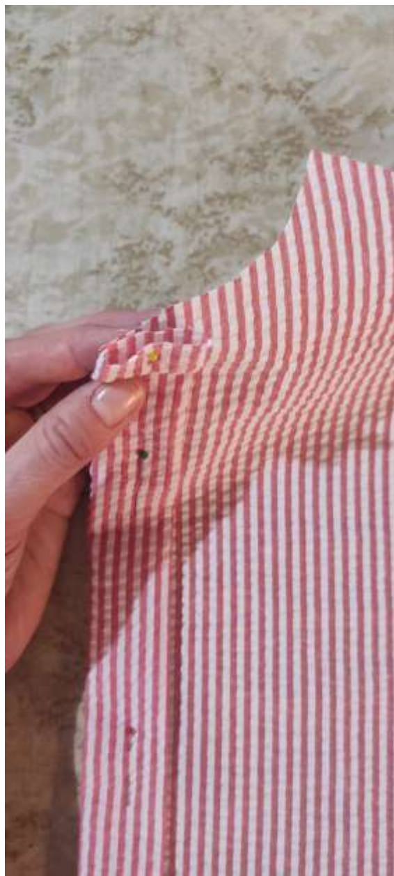
16. Detailní pohled založení légy do lícu.