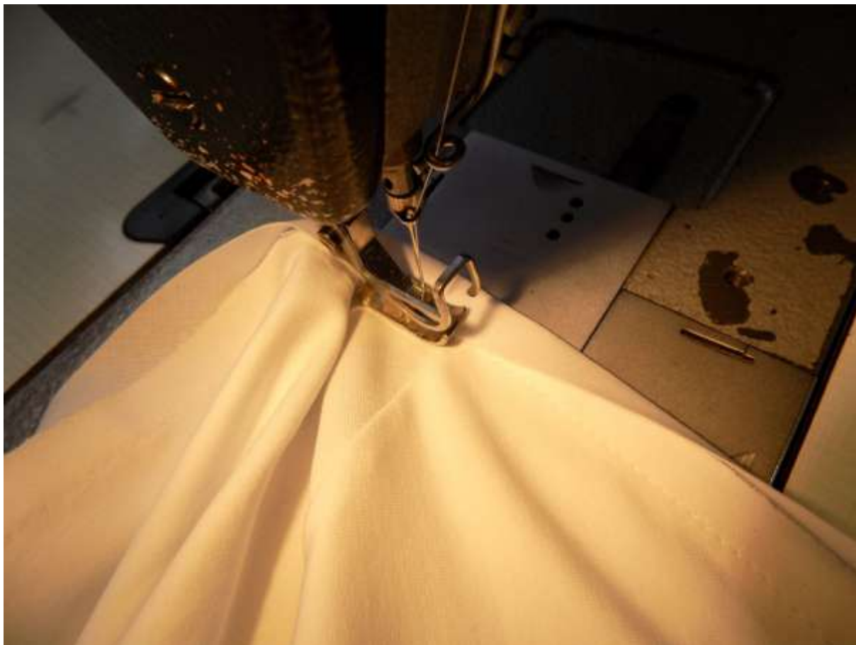
13. Pohled pod patku stroje.